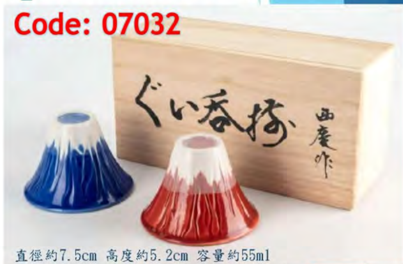
直徑約7.5cm 高度約5.2cm 容量約55ml