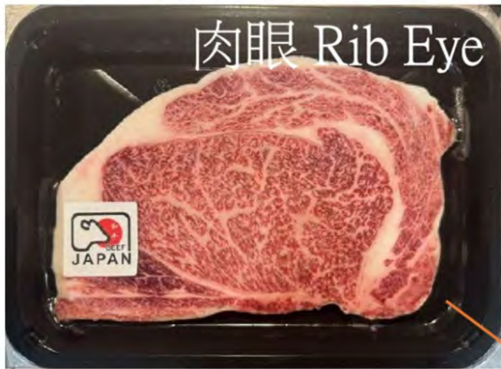
肉眼 Rib Eye