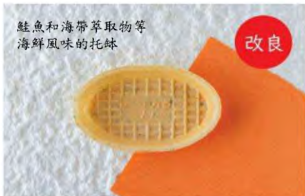
鮭魚和海帶萃取物等 海鮮風味的托鉢