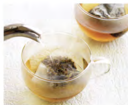
日本的調茶茶包 「莖茶焙茶」淺蒸