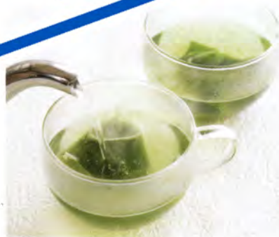
日本的調茶茶包 「上級煎茶」深蒸